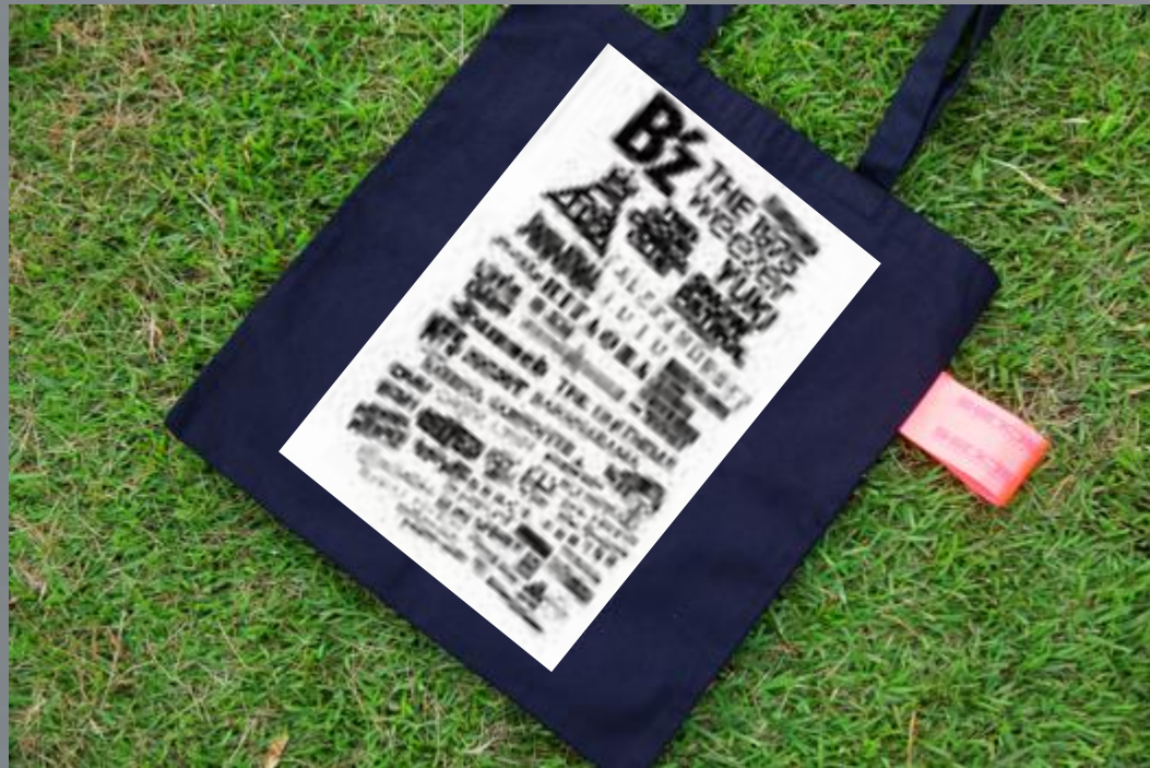
賛同アーティスト名前入り SHIBUKURO

「SHIBUKURO」プロジェクトは、「シブヤのフクロで未来を動かす」をスローガンに、渋谷ならではのメッセージを含めたオリジナルバッグを展開し、カラフルなオリジナルタグから生まれる収益の一部を渋谷の課題解決・まちづくりに還元するプロジェクトです。